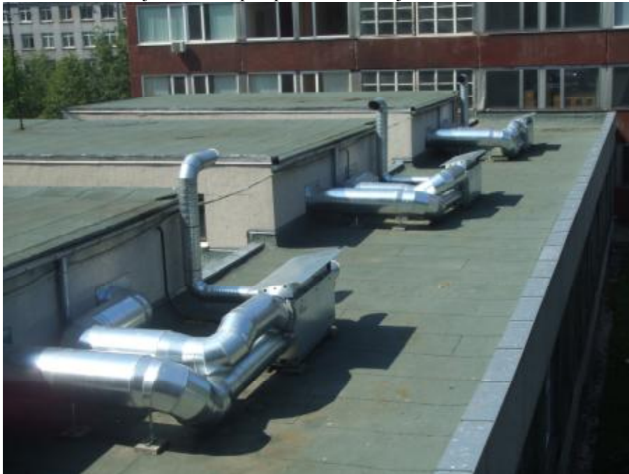
Ventilācijas sistēma 131., 132. un 133.auditorijai.

131., 132. un 133.auditorijai ierīkota piespiedu ventilācijas sistēma