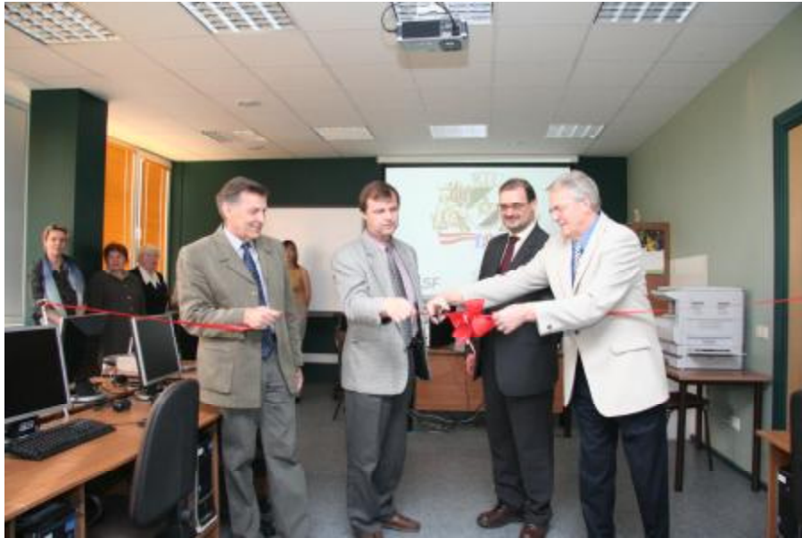
CAD laboratorijas atklāšana

Tēlotājas ģeometrijas un inženierdatorgrafikas profesora grupa ieguvusi digitālu fotogrammetrijas kompleksu arhitektūras un būvobjektu 3D CAD modeļu izveidošanai un ortogonālu attēlu rekonstrukcijai no perspektīvēm, programmatūru Photomodeler, kā arī licencētas CAD programmatūras mācību un zinātniskās pētniecības mērķiem: